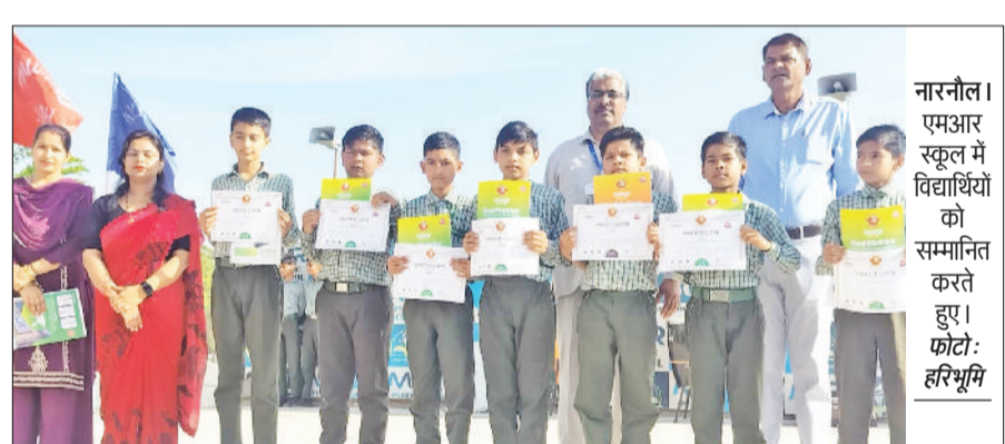
नारनौल। एमआर स्कूल में विद्यार्थियों को सम्मानित करते हुए।