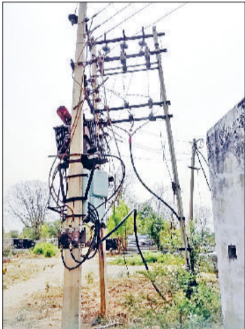
नारनौल। कॉलोनी के बाहर लगा बिजली ट्रांसफार्मर।

बता दें कि जिले के कुल 285 गांवों में बीपीएल परिवारों के लिए कॉलोनियां बसाई गई हैं। इनमें से 102 कॉलोनियों में पहले ही बिजली की व्यवस्था की जा चुकी है, जबकि अब शेष 183 कॉलोनियों में विद्युतीकरण किया जाएगा। इस कार्य के पूरा होने के बाद इन कॉलोनियों में रहने वाले हजारों गरीब परिवारों को बिजली की सुविधा मिल सकेगी और उनकी बस्तियां भी रोशनी से जगमग हो उठेंगी। इन बीपीएल कॉलोनियों की स्थापना पिछली हफ्ता सरकार के कार्यकाल में की गई थी। उस समय गरीब परिवारों को आवास उपलब्ध कराने के उद्देश्य से महात्मा गांधी ग्रामीण बस्ती योजना के तहत बीपीएल श्रेणी के परिवारों को 100-100 गज के प्लॉट