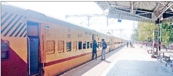
नारनौल। रेलवे स्टेशन।

रेलवे की ओर से आगामी गर्मियों की छुट्टियों पर अतिरिक्त यात्री यातायात को देखते हुए यात्रियों की सुविधा हेतु तीन जोड़ी स्पेशल रेलसेवाओं का संचालन किया जा रहा है। उत्तर पश्चिम रेलवे के मुख्य जनसम्पर्क अधिकारी अमित सुदर्शन के अनुसार गाड़ी संख्या 09633/09634 रेवाड़ी-रीगस-रेवाड़ी स्पेशल रेलसेवा में रेवाड़ी से एक अप्रैल से पांच अप्रैल, 11 व 12 अप्रैल, 18, 19, 25, 26, 30 अप्रैल, दो मई, तीन मई, नौ, 10, 12, 16, 17, 23, 24, 26, 30 व 31 मई, छह जून, सात, 10, 13, 14, 20, 21, 24, 25, 27 व 28 जून को को (35 ट्रिप) का व रीगस से दो अप्रैल, तीन, चार, पांच, छह, 12, 13, 19, 20, 26, 27 अप्रैल, एक मई, तीन, चार, 10,