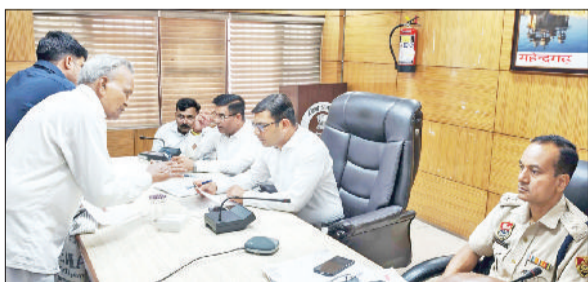
नारनौल। समाधान शिविर में जन समस्याएं सुनते नगराधीश।